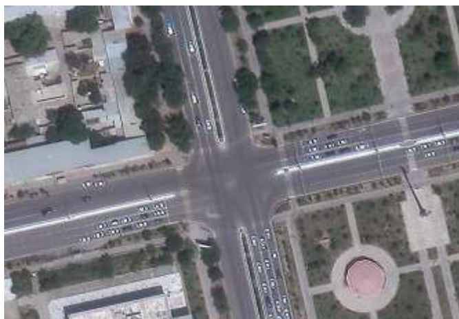
1-rasm. O‘zbekiston va Sayxun ko‘chalari

Tadqiqot obyekti sifatida Guliston shahardagi O‘zbekiston va Sayxun ko‘chalari chorraha shahar markaziy hududida joylashgan bo‘lib, yuqori transport yuklamasiga ega. Chorraha 4 yo‘nalishli bo‘lib, har bir yo‘nalishda transport oqimining intensivligi turlicha (1-rasm).